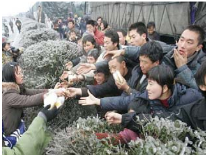
2.7 万辆车、8 万多名乘客和司机滞留在京珠高速公路湖南境内，有些乘客被困几天没吃东西。图为被困人群抢食品

大小媒体的报道讲的都是干部领导如何奔赴救灾第一线，而对于真实的灾害则避而不谈。民众要想了解情况，只能突破中共的网络封锁，通过海外不受中共管制的媒体了解。一个远在他