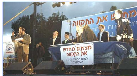
各宗教领袖吁中共停止反人类罪行

二月十八日，全球传递的人权圣火到达以色列，并在特拉维夫市中心举行了火炬接力仪式。