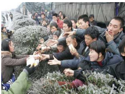
2.7 万辆车、8 万多名乘客和司机滞留在京珠高速公路湖南境内，有些乘客被困几天没吃东西。图为被困人群抢食品

大小媒体的报道讲的都是干部领导如何奔赴救灾第一线，而对于真实的灾害则避而不谈。民众要想了解情况，只能突破中共的网络封锁，通过海外不受中共管制的媒体了解。一个远在他