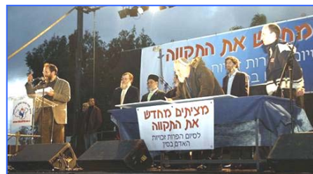
各宗教领袖吁中共停止反人类罪行

二月十八日，全球传递的人权圣火到达以色列，并在特拉维夫市中心举行了火炬接力仪式。