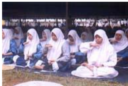
印尼回教徒信女学炼法轮功