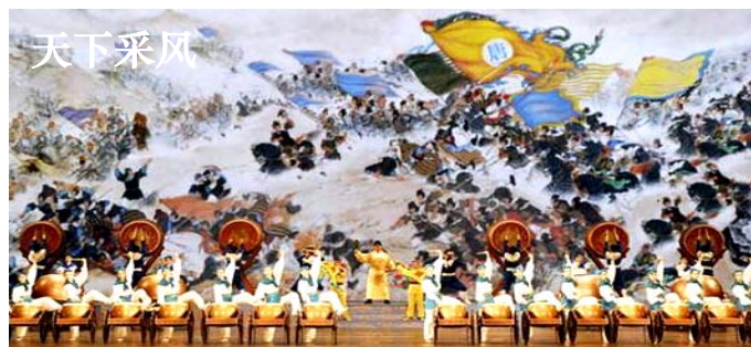
▲神韵节目《威风战鼓》

——这份法轮功学员冒着生命危险送给您的“真相”。虽是小小的一份传单，却是无法用价值来衡量，因为她寄托着法轮功学员们对您最真挚的祝福：明白真相，明白法轮大法好，愿您有最美好的未来！◇