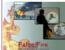
揭露自焚的影片《伪火》获第51届哥伦布国际电影节荣誉奖。