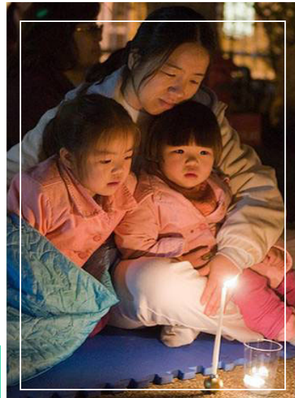
洛杉矶烛光守夜中的母女三人

2008年2月22日晚，来自多国的法轮功学员在洛杉矶中共领馆前举行烛光悼念活动。据不完全统计已经有 3139 名法轮功学员被迫害致死。而被中共活体摘取器官等秘密杀害的人数根本无法统计。法轮功学员呼吁善良的世人能够支持正义，谴责中共暴行，营救仍被非法囚禁的法轮功学