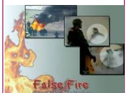
揭露自焚的影片《伪火》获第 51 届哥伦比亚国际电影节荣誉奖。