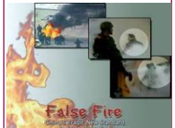
揭露自焚的影片《伪火》获第 51 届哥伦比亚国际电影节荣誉奖。