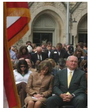
州长普度和夫人在祈雨仪式上虔诚祷告

2007 年美国东南部遭遇百年大旱，11 月 13 日，乔治亚州州长桑尼·普度率领众官员等二百多人在州政府广场举行“恭敬虔诚”的祈雨祷告。14 日晚乔州干旱地区神奇般降下暴雨。1986 年乔治亚州大旱时，州长哈瑞斯率领大众在教堂祈雨礼拜，结果也真的天降甘霖。