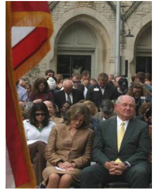
州长普度和夫人在祈雨仪式上虔诚祷告

2007 年美国东南部遭遇百年大旱，11 月 13 日，乔治亚州州长桑尼·普度率领众官员等二百多人在州政府广场举行“恭敬虔诚”的祈雨祷告。14 日晚乔州干旱地区神奇般降下暴雨。1986 年乔治亚州大旱时，州长哈瑞斯率领大众在教堂祈雨礼拜，结果也真的天降甘霖。