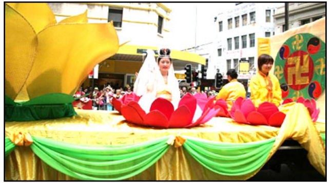
鲜艳亮丽的莲花花车中坐洁美丽的仙女

瓦格洛兹议员经过详细了解、查证后, 与二十五位众议员共同起草了一零九号决议, 要求美国政府对中