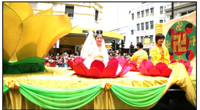
鲜艳亮丽的莲花花车中坐洁美丽的仙女

【明慧网】日前, 由修炼法轮功的艺术家们组成的神韵艺术团正在欧洲及亚洲巡演。纽约艺术团结束了亚洲日本和韩国的演出, 正在台湾巡演; 而神韵巡回艺术团刚刚结束了在伦敦演出, 神韵所到之处反响热烈, 得到韩国和伦敦多位政要的祝贺。神韵在伦敦皇家节日音乐厅的四场演出, 场场爆满, 出现该剧院 50 多年历史