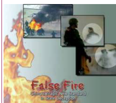
揭露自焚的影片《伪火》获第 51 届哥伦比亚国际电影节荣誉奖。