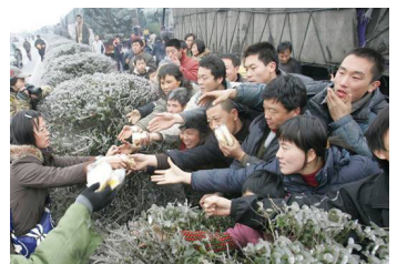
2.7万辆车、8万多名乘客和司机滞留在京珠高速公路湖南境内，有些乘客被困几天没吃东西。图为被困人群抢食品