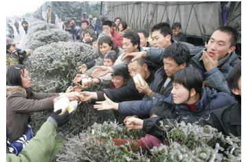
2.7万辆车、8万多名乘客和司机滞留在京珠高速公路湖南境内，有些乘客被困几天没吃东西。图为被困人群抢食品