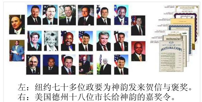
左：纽约七十多位政要为神韵发来贺信与褒奖。 右：美国德州十八位市长给神韵的嘉奖令。

感谢神韵不仅给世界带来了美丽的惊喜，更让我们回忆起了一个有着五千年历史、孕育了博大精深传统文化的古老的国度。那里曾是万国来朝的礼仪之邦；那里曾经孕育了无数英雄儿女、大德之士……在珍贵的传统文化被中共破坏殆尽，中华民族信仰空虚的今天，是神韵再次帮助我们寻回了民族的精神、民族的根，让我们看到了中华文化复兴的希望，让世界看到了中国人的真正风采！