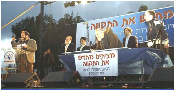
各宗教领袖吁中共停止反人类罪行

【明慧网】二月十八日，全球传递的人权圣火到达以色列，并在特拉维夫市中心举行了火炬接力仪式。活动在以色列引起巨大反响，全国性的新闻媒体对活动进行了密集报导，各大宗教及种族领袖签定共同契约，要求中共立即停止反人类罪行。