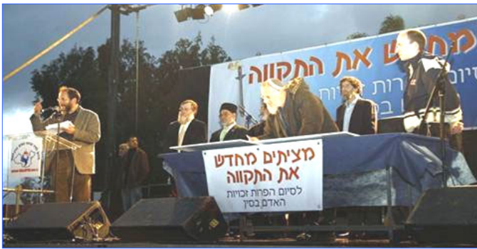
各宗教领袖吁中共停止反人类罪行

【明慧网】二月十八日，全球传递的人权圣火到达以色列，并在特拉维夫市中心举行了火炬接力仪式。活动在以色列引起巨大反响，全国性的新闻媒体对活动进行了密集报导，各大宗教及种族领袖签定共同契约，要求中共立即停止反人类罪行。