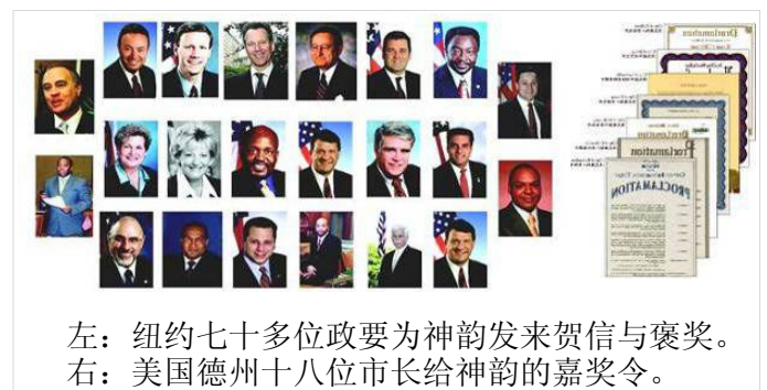
左：纽约七十多位政要为神韵发来贺信与褒奖。 右：美国德州十八位市长给神韵的嘉奖令。

感谢神韵不仅给世界带来了美丽的惊喜，更让我们回忆起了一个有着五千年历史、孕育了博大精深传统文化的古老的国度。那里曾是万国来朝的礼仪之邦；那里曾经孕育了无数英雄儿女、大德之士……在珍贵的传统文化被中共破坏殆尽，中华民族信仰空虚的今天，是神韵再次帮助我们寻回了民族的精神、民族的根，让我们看到了中华文化复兴的希望，让世界看到了中国人的真正风采！