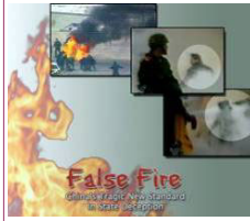
揭露自焚的影片《伪火》获第 51 届哥伦比亚国际电影节荣誉奖。