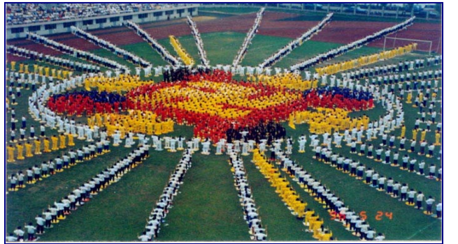
▲1996 年 5 月 24 日武汉法轮功学员在市四中集体排字炼功的照片

法轮功主要著作《转法轮》、《法轮功》已翻译成 30 种语言在世界各地出版发行。并可在计算机网络上免费下载、复制。