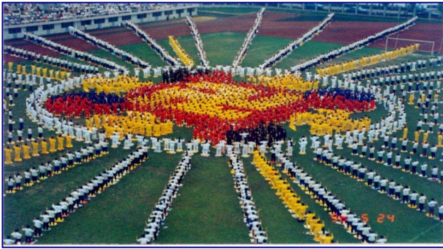
▲1996 年 5 月 24 日武汉法轮功学员在市四中集体排字炼功的照片

法轮功主要著作《转法轮》、《法轮功》已翻译成 30 种语言在世界各地出版发行。并可在计算机网络上免费下载、复制。