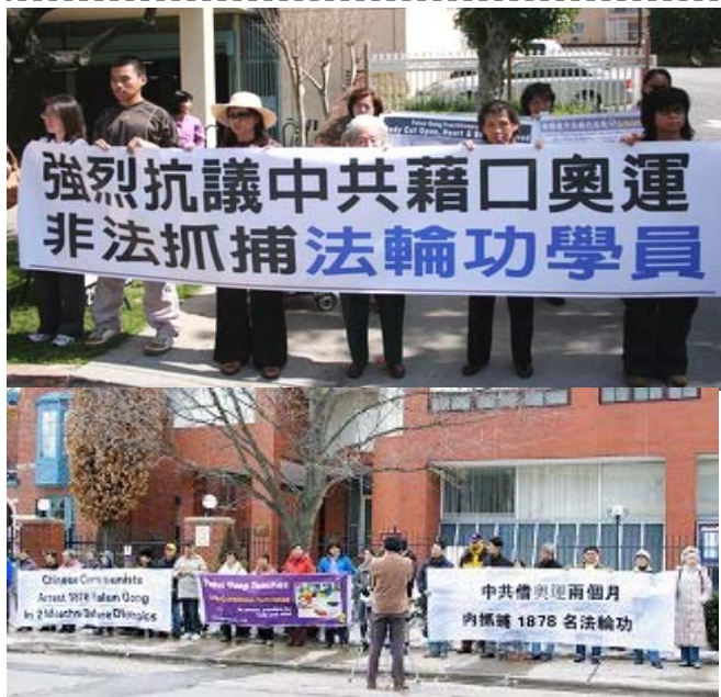
世界各地法轮功学员中领馆前集会抗议中共暴行

二零零八年北京奥运会临近，中共正以所谓“成功举办奥运”的名义对中国大陆法轮功学员和其他维权团体、信仰团体进行新一轮抓捕迫害。连日来，世界各地正义人士举行抗议集会，强烈谴责中共利用奥运加剧迫害中国民众的行径，同时呼吁社会大众了解法轮功真相，帮助制止在中国持续了近九年来对法轮功学员的残酷迫害。