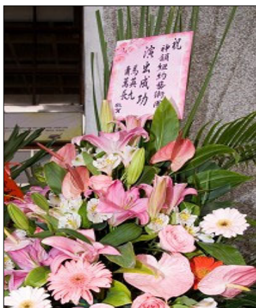
马英九、萧万长致贺花篮。

神韵纽约艺术团在台湾北中南的演出，均获得满堂采，挟着台北政治界、艺文界、学术界、产业界、金融界等各阶层贵宾对神韵晚会的赞叹，神韵 20 日移驾到嘉义演出两场。这也是神韵 2008 年在台湾演出的最后一天，众多政要、学者均给予花篮、挂轴祝贺。中华民国总统陈水扁、行政院长张俊雄、立法院长王金平、考试院长姚嘉文或致赠花篮、或发函祝贺神韵演出圆满成功。