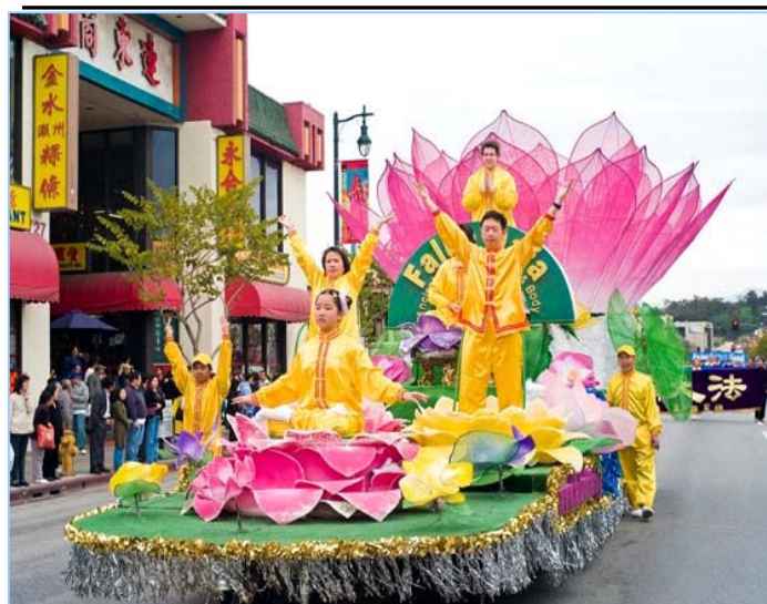
▲中西方法轮功学员在莲花车上展示法轮功的五套功法