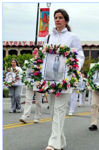
▲肃穆的气氛传递着大陆法轮功学员被迫害的真相