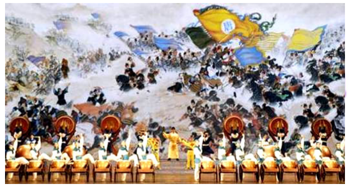
▲神韵节目《威风战鼓》

考虑到这位副县长仍在职，故在此不写出其真实姓名。一九九九年“七·二零”期间，中共派他统管县“六一零”，迫害法轮功学员。因他曾看过《转法轮》等大法书籍，明白法轮大法是正法，