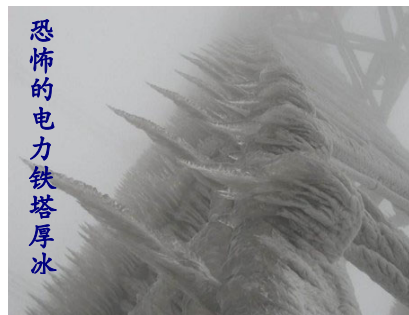
恐怖的电力铁塔厚冰

面对着愈演愈烈的天灾人祸，我们是否应该反思一下：“善恶有报”是迷信还是天理？“天人合一”和“战天斗地”，到底哪个才是正