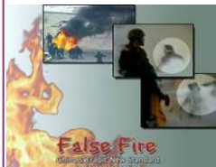
揭露自焚的影片《伪火》获第51届哥伦布国际电影节荣誉奖。