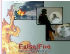
揭露自焚的影片《伪火》获第51届哥伦布国际电影节荣誉奖。