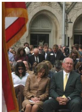
州长普度和夫人在祈雨仪式上虔诚祷告

来固有的认识。中国古代每逢遭遇天灾，人们除了祈求上天的庇护外，最重要的是反省自己哪里做的不好。皇帝也要下「罪己诏」。据殷商史书上记载，商朝的开国君主成汤在位时，因久旱无雨，作为一国之君的成汤就沐浴斋戒，在桑林旷野中向神祷告，并深刻反省自己的执政过失，进行深刻自我反省，结果方圆数千里便下起了大雨。这种临灾自省的文化在中国延续了几千年。