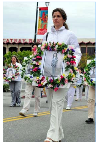
▲肃穆的气氛传递着大陆法轮功学员被迫害的真相

沿途，不少了解法轮功真相的中西方人士纷纷谈论：“是法轮功”，“啊！真、善、忍”。有的观众竖起大拇指，表达对法轮功学员的支持和鼓励。有观众表示：很赞赏法轮功学员们非凡的勇气，也希望中国百姓早日获得真正的自由。◇