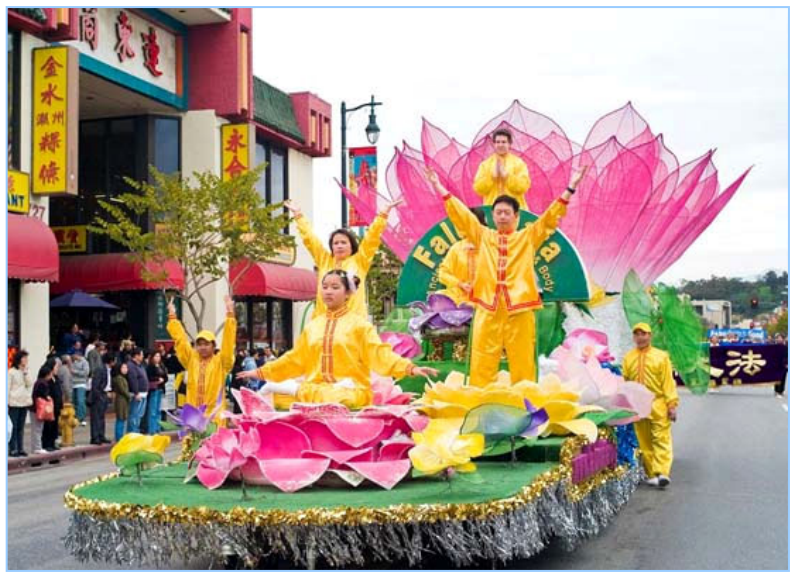
▲中西方法轮功学员在莲花车上展示法轮功的五套功法