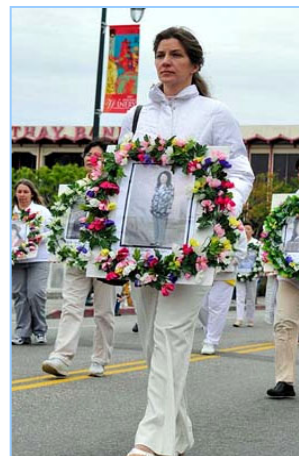
肃穆的气氛传递着大陆法轮功学员被迫害的真相

沿途，不少了解法轮功真相的中西方人士纷纷谈论：“是法轮功”，“啊！真、善、忍”。有的观众竖起大拇指，表达对法轮功学员的支持和鼓励。有观众表示：很赞赏法轮功学员们非凡的勇气，也希望中国百姓早日获得真正的自由。◇