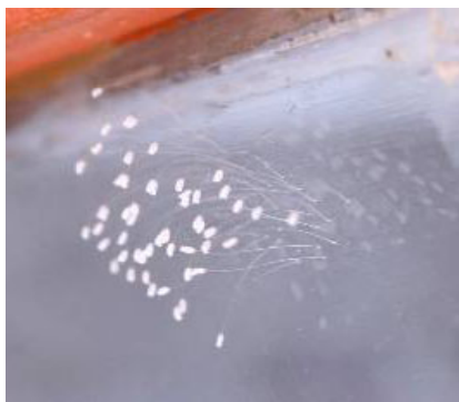
雄县百姓家玻璃上盛开的优昙婆罗花

“优昙婆罗花”是传说中的仙界极品之花，因其花“青白无俗艳”被尊为佛家花。婆罗奇花花茎细如发丝、蚕丝，色如玉，白如雪，花形如钟，周围散着淡淡的光晕，有的散发出淡淡清香。用放大镜细看：花瓣微张、有光晕；花茎纤细、有韧劲；无叶相衬，无枝相绕，均现一根、一茎、一花之玉体。