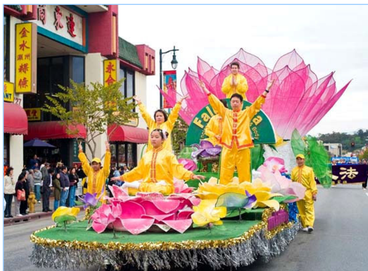
中西方法轮功学员在莲花车上展示法轮功的五套功法