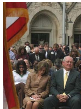
州长普度和夫人在祈雨仪式上虔诚祷告

也许您会吃惊,但这却是我们中华传统文化几千年来固有的认识。中国古代每逢遭遇天灾,人们除了祈求