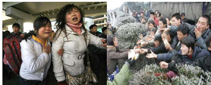
▲广州火车站，两年轻女性面对混乱的场面无助的哭泣。

八十年代美国发了一场大水灾，对民众一个问讯调查结果是：美国有相当比例的人认为这场水灾是上天对美国所做的不好的事情的惩罚。此报道令很多中国人吃惊：在科技如此发达的美国怎么会有这么多人持有这种“封建迷信”思想？而且，就在前段时间还有一位美国