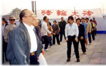
图为 98 年 5 月 15 日伍绍祖亲赴法轮功发祥地长春考察。

病健身总数有 效率高达 97.9 %。平均每人每 年节约医药费 1700 多元,每年 共节约医药费 2100 多万元。