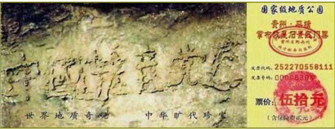
▲ 零二年六月贵州平塘县掌布乡发现了二亿七千万年前的藏字石，巨石断面上惊现六个大字：中国共产党亡，昭示着“天灭中共”的天象。图为藏字石风景区门票。

2002 年 6 月在贵州境内平塘县掌布乡桃坡村掌布河谷风景区发现了“藏字石”，此石是从五百年前石壁上坠落而下后分为两半，右石裂面清晰可见“中国共产党亡”六个横排大字，其中那个“亡”字特别的大。字体匀称方整，每字近一尺见方。如下图所示，中共媒体报道时省去了那个“亡”字，当地政府看准了这个发财的机会，开辟为旅游点，并附上一些为邪党歌功颂德的文字说明。