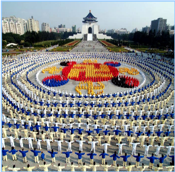
▲2005 年 12 月 25 日, 4000 多名台湾法轮功学员在台北中正纪念堂广场前排组法轮图形, 展示法轮大法洪传世界的辉煌