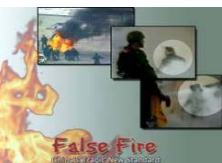
揭露自焚的影片《伪火》获第 51 届哥伦比亚国际电影节荣誉奖。

法轮功学员知道真相的力量有多大，中共邪党也知道真相的力量有多大，但它不知道越是花大力气去掩盖真相，真相的力量就越大。