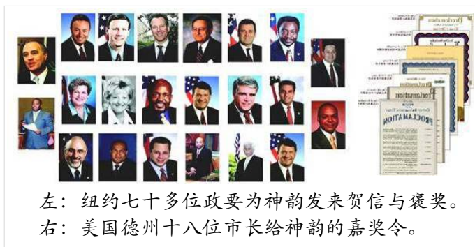
左：纽约七十多位政要为神韵发来贺信与褒奖。 右：美国德州十八位市长给神韵的嘉奖令。

西方人观看后被中华神传文化博大精深的内涵所折服；海外华人观看后更是激动不已，深感神韵复兴了中华文化，是所有华人的骄傲。