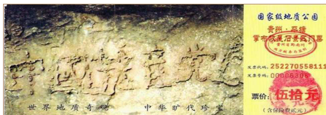
▲掌布风景区门票上“中国共产党亡”的照片

早在 1996 年，把持政法、公安部门的罗干就开始刁难法轮功。因为修炼法轮功的人多，而且传播很快，江泽民出于妒嫉和恐惧，认为法轮功在与它争夺群众。江罗一伙先是利用何祚庥等人诽谤宣传挑起事端，后于 99 年 4 月 23 日指使天津公安殴打、抓捕 40 多名法轮功学员。公安部介入天津市，并告知没有北京的授权不放人，天津警方建议学员去北京上访。学员们基于对政府的信任，用宪法 41 条赋予的上访权，本着善念，向上一级单位国家信访部门反映情况，是当时唯一的选择。