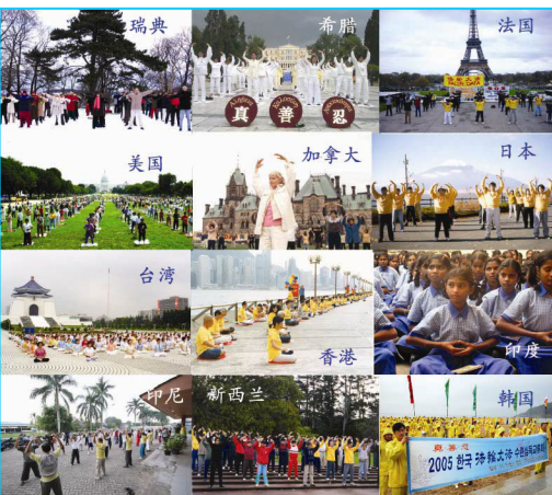
零五年十二月台湾四千多法轮功学员在台北中正纪念馆广场前排组法轮图形，展示法轮大法洪传世界的辉煌。

那么，用同样的目光去思考一下法轮功创始人李洪志先生所做的事情，中国人今天更应感到自豪，好好珍惜。一位美国教授说，如果人们能够理解《转法轮》，他们会明白，医学诺贝尔奖应该授予李洪志先生。仔细思考一下，有哪个诺贝尔医学奖得主对如此广大的人群，用如此低的花费，做过如此重大的医学贡献呢？