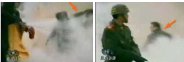
1、류 두부에 강타 2、타격 자는 의연히 힘쓴 자세를 보류

중앙 TV 《초점방탄》 중의 “분신자”들이 엄밀하게 봉대를 감고 있는 장면