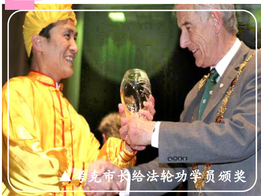
▲考克市长给法轮功学员颁奖

法轮功学员受邀参加考克市（爱尔兰第二大城市）的圣帕特里克日大游行，在四十五个游行团体