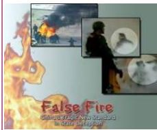
揭露自焚的影片《伪火》获第51届哥伦比亚国际电影节荣誉奖。

有报道说，西藏事件的导火索是中共派遣了一伙暴徒混在藏民中率先砸抢超市、焚毁商店汽车，而且为藏人精心准备了武器——石头，好让他们攻击军警和军车，“暴动”的场面在中共的编导和推进下，藏人上当了，为中共血腥镇压提供了借口，它们把早已安排、精心拍摄的暴动画面在最大的媒体——中央电视台播放，激起人民的愤怒，然后，中共老练地祭出“不杀不足以平民愤”的幌子，大开杀戒。多么冠冕堂皇，多么狡诈奸猾！在八九学潮中，中共一手导演了暴徒焚烧汽车并且烧死军人的惨剧嫁祸学生，然后出动坦克机枪，在天安门广场将学生碾成肉饼，使天安门广场血流成河。