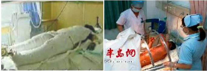
央视中的“自焚者”被包裹得严密。

具有烧伤医护常识的人都知道：大面积烧伤的病人为换药方便，创面要尽量暴露，保持通风干燥，否则很容易造成化脓感染。而焦点访谈中的“自焚者”却全身被包扎的密不透风，是想掩盖什么？