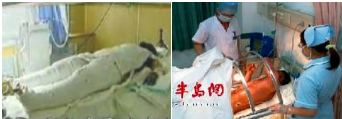
央视中的“自焚者”被包裹得严密。

具有烧伤医护常识的人都知道：大面积烧伤的病人为换药方便，创面要尽量暴露，保持通风干燥，否则很容易造成化脓感染。而焦点访谈中的“自焚者”却全身被包扎的密不透风，是想掩盖什么？