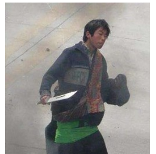
泰国华侨见证中共警察扮演藏人持刀施暴

【明慧网】由西藏僧侣发起的抗议中共暴政、争取人权自由的示威活动，在中共的铁血镇压下引得举世震惊，人们惊呼“又一个‘六四’大屠杀”。西藏事件与当年的八九学潮如出一辙，都是中共栽赃陷害然后血腥镇压的结果。