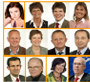
▲瑞典各党派政要致贺词，欢迎神韵。

西方人观看后被中华神传文化博大精深的内涵所折服；海外华人观看后更是激动不已，深感神韵复兴了中华文化，是所有华人的骄傲。