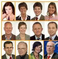
▲瑞典各党派政要致贺词，欢迎神韵。