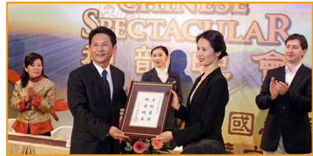
▲台南市政府褒奖神韵纽约艺术团：正统艺术，纯善纯美。