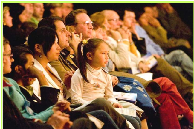
观众聚精会神地欣赏神韵晚会