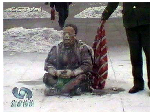
自焚伪案中王进东两腿中间装满汽油的塑料雪碧瓶居然完好无损

了感动和佩服，我的第一念就是，连这样的老太太都风雨无阻的讲真相，信心还那么大，可想这个群体的难能可贵，该是多么了不起！共产（邪）党迫害法轮功，打击善良，诋毁大法，摧毁道德，这次是彻底玩完了，没戏了，邪到头，邪到顶了，谎言没法再继续维持了。法轮功还是法轮功，是打不垮，抹不黑的，迫害更彰显了法轮功所倡导的真、善、忍的真理之光。◇