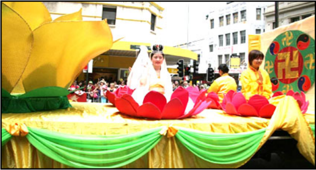
鲜艳亮丽的莲花花车中坐着圣洁美丽的仙女

等待了许久的期盼 人们啊，在恶警把我抓走之前 我一定要告诉你们 请记住“法轮大法好” 为了让你们听到这句真言 我失去了我曾拥有的一切 只剩这身破衣烂衫 却无悔无怨