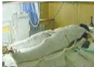
央视中的“自焚者” 被包裹得严密。

具有烧伤医护常识的人都知道：大面积烧伤的病人为换药方便，创面要尽量暴露，保持通风干燥，否则很容易造成化脓感染。而焦点访谈中的“自焚者”却全身被包扎的密不透风，是想掩盖什么？