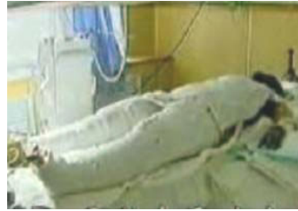
央视中的“自焚者” 被包裹得严密。

具有烧伤医护常识的人都知道：大面积烧伤的病人为换药方便，创面要尽量暴露，保持通风干燥，否则很容易造成化脓感染。而焦点访谈中的“自焚者”却全身被包扎的密不透风，是想掩盖什么？