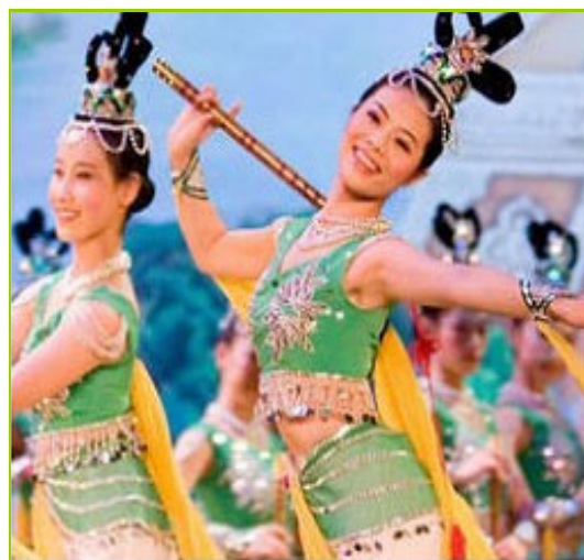
Tanz-Tradition aus dem Reich der Mitte