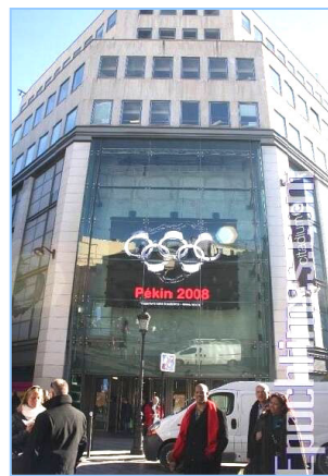
巴黎 Citadium 商店的户外电子屏显示出“记者无疆界”设计的著名标志：北京 2008 手铐五环奥运图

用“奥运”和“政治任务”上网查询，真是全国一盘棋，处处都把奥运当作中心工作的政治任务。不但北京天津和各个省市要把奥运当作“重要光荣”“当前压倒一切”