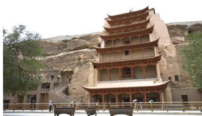
莫高窟，又称千佛洞，洞窟中的千年彩绘壁画和塑像，记述着当年的修炼故事，后人称其为神话。

这一天，两人高高兴兴的来到庙里，用发抖的手捧着血汗换来的小金钱，对画工至诚地说：