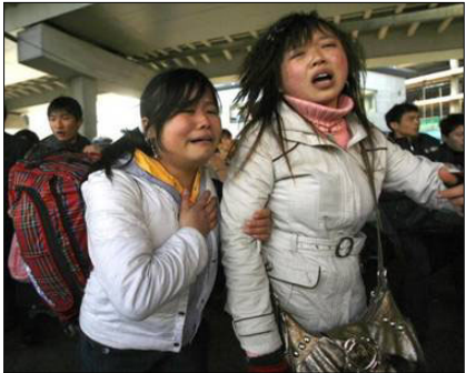
广州火车站，两年轻女性面对混乱的场面无助的哭泣。

从2008年1月10日开始，在中国的长江流域南北，突降大雨和暴雪，大约18个省市遭灾，公路、铁路和航空运输瘫痪，很多旅客滞留机场和火车站，缺衣少食；有的地方断水断电半个月。受灾人口超过1亿人，直接经济损失达到537.9亿人民币。饿死、冻死、挤死的人数目前无法计算，据一线报道，一条公路上就死亡200多人。