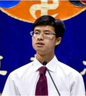
图：本文作者胡先生在 2008 年美国西部法轮功修炼交流会上发言。本文节选自胡先生发言稿。

二零零二年，我被派往国外学习。我在计算中心的电脑上打开《转法轮》（法轮功主要著作）。当我看了第一段，心跳就蹦蹦跳跳的加