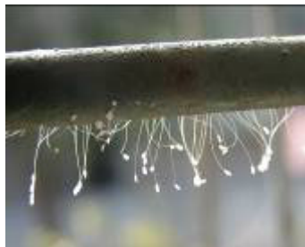
去年在唐山古冶区和市区别发现的佛法优昙婆罗花。

《大纪元》郑重声明指出，共产邪党在历史上对众生、对神佛犯下了滔天大罪，神一定要清算这