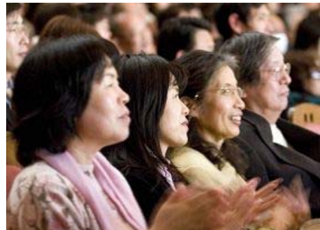
2 월 19 일, 신운 오사카에서의 연출에 관중들은 도취되어 있다.

이 여사는 줄곧 공연절목에 대해 아낌없는 찬사를 보냈다. 《저의 아들에게는 진정한 중국 고대의 역사문화를 접착할 기회가 아주 드물어요. 공연의 매 하나의 절목은 모두 고전적이고 전통적인 것이었어요. 그리하여 저는 줄곧 아들에게 이것이 중국 5천년의 역사문화라고 이야기 해 주었어요. 참 잘 됐어요, 저의 아들은 보고 나서 아주 기뻐해요.》