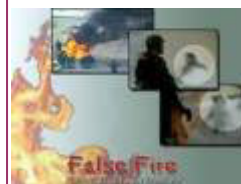
揭露自焚的影片《伪火》获第 51 届哥伦布国际电影节荣誉奖。