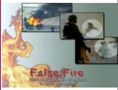
揭露自焚的影片《伪火》获第 51 届哥伦布国际电影节荣誉奖。