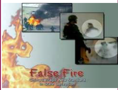
揭露自焚的影片《伪火》获第 51 届哥伦布国际电影节荣誉奖。

生在全国已经得到了一百四十名加拿大医生的签名支持。这份请愿信在二零零七年十二月被呈交到国会。”