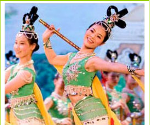
Tanz-Tradition aus dem Reich der Mitte

▲ 德国《柏林报》三月十三日用“最美的中国人从纽约来”为题，宣告神韵的到来。神韵艺术团由修炼法轮功的艺术家组成，致力于弘扬中华正统文化。