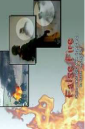
揭露自焚的影片《伪火》获第51届哥伦布国际电影节荣誉奖。

多事件更是被中共信手拈来嫁祸法轮功，说法轮功闹事。天安门自焚事件是轰动国际、使迫害法轮功再次升级的最大事件。人为扮演的自焚，露出了太多的破绽：