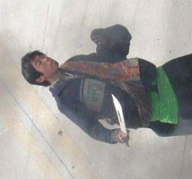
泰国华侨见证中共警察扮演藏人持刀施暴。

由西藏僧侣发起的抗议中共暴政、争取人权自由的示威活动，在中共的铁血镇压下引得举世震惊，人们惊呼“又一个‘六四’大屠杀”。西藏事件与当年的八九学潮如出一辙，都是中共栽赃陷害然后血腥镇压的结果。