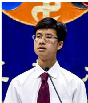
图：本文作者胡先生在2008年美国西部法轮功修炼交流会上发言。本文节选自胡先生发言稿。

即使有大灾，神也会保佑我的。《九评共产党》和大纪元的声明传达的资讯已经再清楚不过了，如果你是个好人，退党不是神给你的一个机会吗？