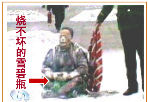
▲ 被中共写进学生课本的另一出谎言“天安门自焚”，同样漏洞百出——人烧糊了，装汽油的塑料雪碧瓶却烧不坏。中共以此煽动人们的仇恨，为迫害法轮功制造借口。

可怜我们几代中国人，就这么在“半夜鸡叫”中被共产党骗了一代又一代，让无中生有的仇恨在心里发了芽。