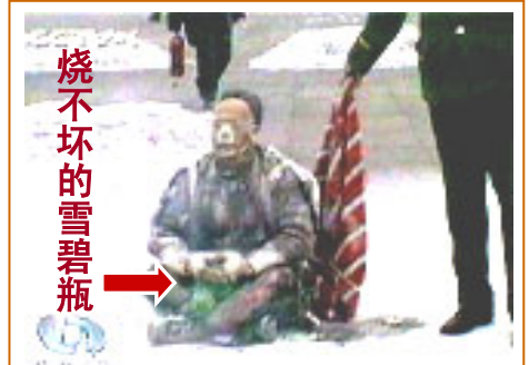
▲ 被中共写进学生课本的另一出谎言“天安门自焚”，同样漏洞百出——人烧糊了，装汽油的塑料雪碧瓶却烧不坏。中共以此煽动人们的仇恨，为迫害法轮功制造借口。

可怜我们几代中国人，就这么在“半夜鸡叫”中被共产党骗了一代又一代，让无中生有的仇恨在心里发了芽。