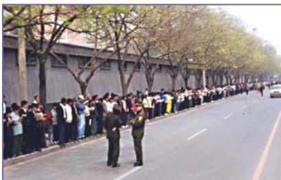
上访的法轮功学员文明安静，警察不用维持秩序，在一旁聊天。学员背后不是中南海红墙，所谓的“围攻中南海”根本不存在。

中央政府的信任和期待，纷纷自发通过上访国务院信访办的途径，来寻求“天津事件”的公正解决（注：信访办与中南海相邻，并非其党宣传的“包围中南海”）。四月二十五日中午，朱镕基