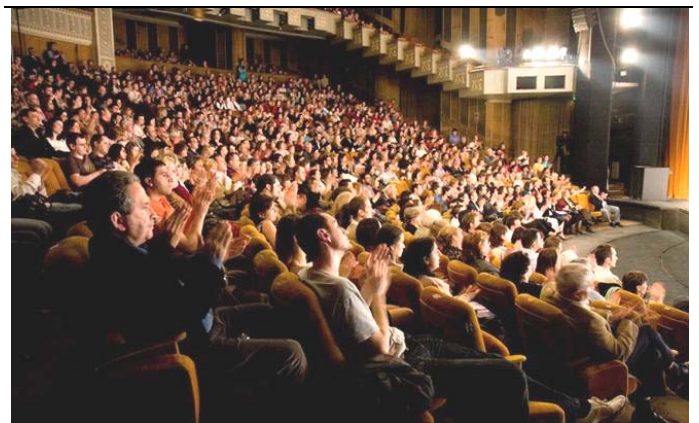
▲零八年四月八日晚，神韵巡回艺术团在罗马尼亚布加勒斯特国家大剧院的演出盛况空前，各界一致赞誉。