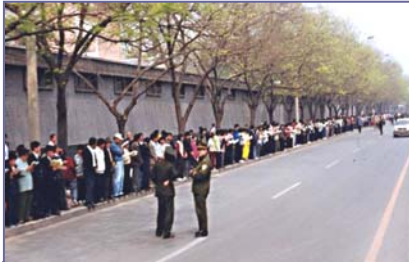
上访的法轮功学员文明安静，警察不用维持秩序，在一旁聊天。学员背后不是中南海红墙，所谓的“围攻中南海”根本不存在。

中央政府的信任和期待，纷纷自发通过上访国务院信访办的途径，来寻求“天津事件”的公正解决（注：信访办与中南海相邻，并非其党宣传的“包围中南海”）。四月二十五日中午，朱镕基