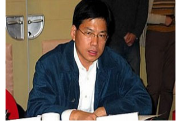
中国文化部刘军宁

2007 年 10 月 26 日，安徽省政协常委汪兆钧发表四万字的致胡锦涛、温家宝公开信，信中呼吁：