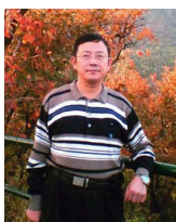
安徽政协常委汪兆钧