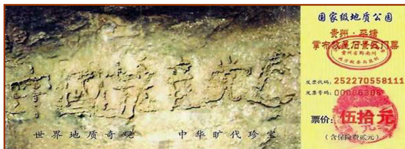
左图为贵州省平塘县掌布乡国家地质公园门票

从天理看： 善恶报应的天理决定了作恶多端的中共必遭天惩。中共窃国以来，破坏道德，打击善良，迫害正信，毒害人民。自然环境被强力破坏，传统道德丧失殆尽，贪污腐败盛行、黑社会、吸毒、卖淫充斥中国大地，人民的合法权利、言论自由被剥夺。这一切都是不信神佛、战天斗地的中共的邪恶统治带来的恶果。如今，中共祸乱中国半个多世纪，在历次运动中造成了八千万中国人非正常死亡，更甚者迫害正信——镇压法轮功，残害这些修炼人，真是逆天叛道，自己选择了自灭的命运。善恶到头终有报，“天灭中共”实乃天意之必然。