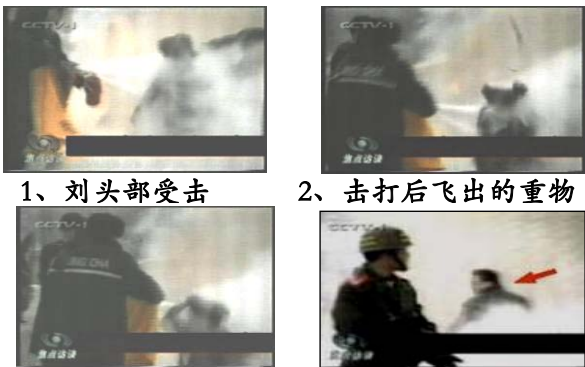
1、刘头部受击 2、击打后飞出的重物 3、手摸被打后的头部 4、击打者仍保持用力姿势 20

就这样，几年来我们互通有无的看了不少真相资料，明白了许多道理，对法轮功学员用自己的积