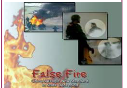
揭露自焚的影片《伪火》获第 51 届哥伦布国际电影节荣誉奖。