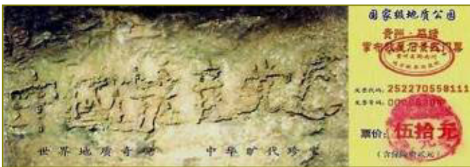
图为藏字石风景区门票：“中国共产党亡”清晰可见

做了坏事会造下罪业，将来灾祸连连，罪恶大的自己偿还不了就要祸及子孙。今天我们出于善心给你写信，真心希望你明白真相，选择一个美好的未来。记住：善待大法和大法弟子就是善待自己！