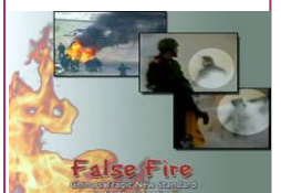
揭露自焚的影片《伪火》获第 51 届哥伦布国际电影节荣誉奖。