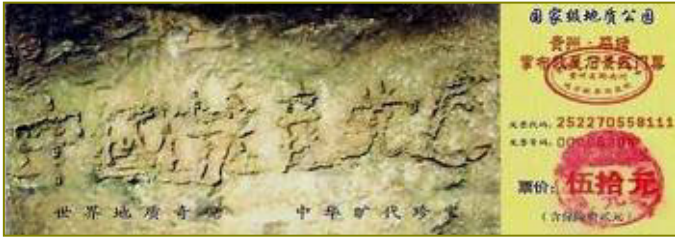
图为藏字石风景区门票：“中国共产党亡”清晰可见

做了坏事会造下罪业，将来灾祸连连，罪恶大的自己偿还不了就要祸及子孙。今天我们出于善心给你写信，真心希望你明白真相，选择一个美好的未来。记住：善待大法和大法弟子就是善待自己！