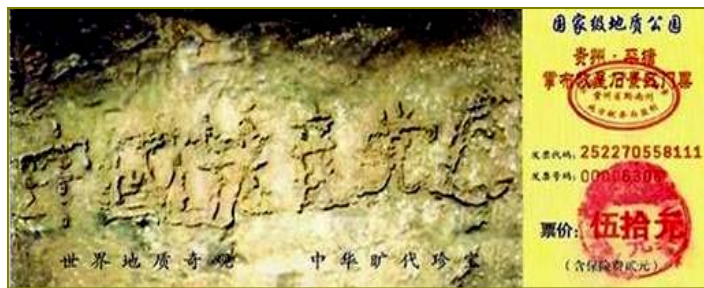
图为藏字石风景区门票：“中国共产党亡”清晰可见

称为“藏字石”。经专家鉴定该巨石是二亿七千万年前生成、五百年前从山上滚下裂开的，系天然形成。可见上天早已注定了中共走向灭亡的命运！