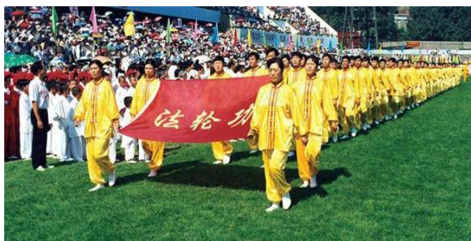
法轮功学员在亚州体育节开幕式上列队入场 (沈阳 1998)

1992年5月13日,李洪志先生于长春开办了第一期学习班,将法轮大法公诸于世。法轮大法以宇宙特性“真善忍”指导人修心向善,从根本上祛除病疾、净化身心灵,使真修者最终达到返本归真的境界。从那时开始到1994年12月,李洪志先生先后由各地官方气功科学研究会邀请,在中国举办54个讲法面授班,学员几十万人。至1999年短短7年,由于其神奇的功效,人传人,心传心,修者近亿,遍及全国各阶层。闻者寻之、得者喜之;人们因修炼法轮功而无疾无病,人们