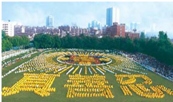
湖北武汉,约5000名法轮功学员集体炼功,组排“法轮图形”和“真善忍”等(1997)

1995年1月法轮功主要著作《转法轮》由中国广播电视出版社出版发行,《转法轮》自出版后一直供不应求,1996年1月被《北京青年报》列入北京市十大畅销书。