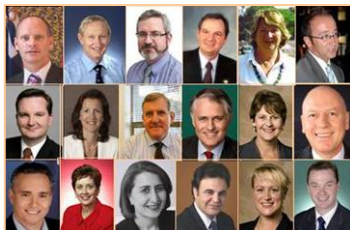
▲神韵晚会为澳洲观众带来了中华传统文化的纯善纯美。澳大利亚六十多位政要致信欢迎神韵纽约艺术团到来，并祝贺演出圆满成功。