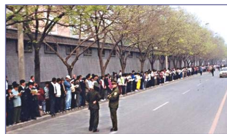
▲四·二五上访现场，法轮功学员文明安静，警察不用维持秩序，在一旁聊天。学员背后不是中南海红墙，所谓的“围攻中南海”根本不存在。

“四·二五”上访简介：一九九九年四月二十三日，天津市公安局殴打和非法逮捕当地法轮功学员。学员在天津市政府被告知，公安部介入了此事，你们去北京才能解决问题。出于对政府的信任，法轮功学员四月二十五日自发来到国务院