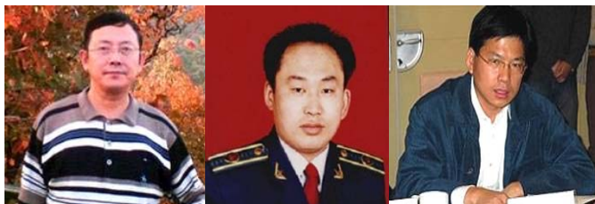
安徽政协常委汪兆钧 山东省公务员孔强 中国文化部刘军宁

【明慧网】安徽省政协常委汪兆钧发表致胡温万言公开信，信中提到当务之急是立即停止迫害法轮功，并对当时决定镇压的决策者追究刑事责任。此信引发海内外各界的关注和响应。