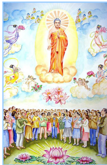
▲ 以色列大法弟子的画

五月十三日，是“世界法轮大法日”。十六年前的这一天，法轮大法在中国大陆公开传出。至今，大法已洪传世界八十多个国家，“真善忍”的修炼使上亿人达到了身体健康、道德升华。每年的这一天，各国法轮功学员都会举行庆祝活动，和当地的善良民众们一起，欢庆这个伟大节日。