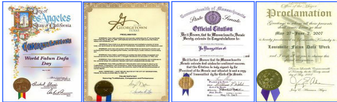
上图为美、加各级政府发来的贺状褒奖法轮大法。

1992年5月13日，是法轮大法开传的日子，也是法轮功创始人李洪志师尊的华诞。十六年前的这一天，李洪志师尊在吉林长春首次把法轮大法面向社会传出，以“真善忍”为修炼原则，开启人们的心智，使上亿人的道德回升，体魄强健。法轮大法至今已洪传世界80多个国家和港澳台地区，至2008年3月，各国政府机构、团体组织对法轮大法及其创始人颁发的褒奖与支持议案信函已达2945项。法轮功主要著作《转法轮》、《法轮功》已翻译成30种语言在世界各地出版发行。并可在计算机网络上免费下载、复制。2000年5月13日，第一个“世界法轮大法日”诞生。每年的这一天，美、欧、亚、澳洲的各国法轮功学员举行盛大游行、文艺演出等活动，表达对师父的感恩，欢庆“世界法轮大法日”。