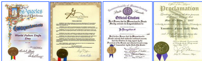
上图为美、加各级政府发来的贺状褒奖法轮大法。

1992年5月13日，是法轮大法开传的日子，也是法轮功创始人李洪志师尊的华诞。十六年前的这一天，李洪志师尊在吉林长春首次把法轮大法面向社会传出，以“真善忍”为修炼原则，开启人们的心智，使上亿人的道德回升，体魄强健。法轮大法至今已洪传世界80多个国家和港澳台地区，至2008年3月，各国政府机构、团体组织对法轮大法及其创始人颁发的褒奖与支持议案信函已达2945项。法轮功主要著作《转法轮》、《法轮功》已翻译成30种语言在世界各地出版发行。并可在计算机网络上免费下载、复制。2000年5月13日，第一个“世界法轮大法日”诞生。每年的这一天，美、欧、亚、澳洲的各国法轮功学员举行盛大游行、文艺演出等活动，表达对师父的感恩，欢庆“世界法轮大法日”。